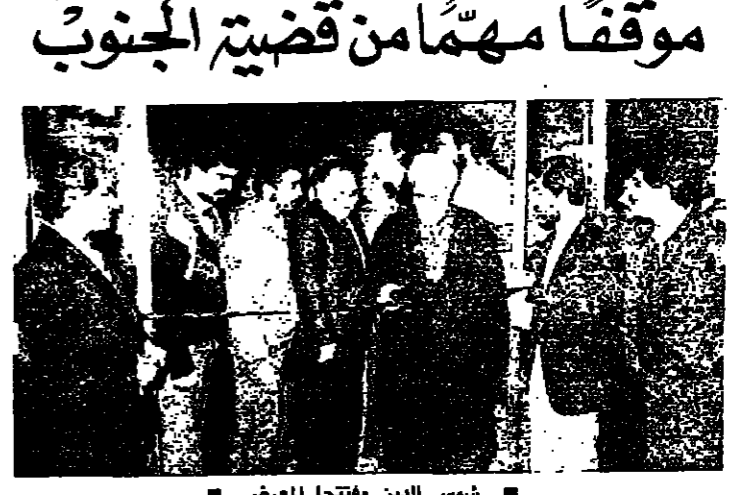
شمس الدين مفتحا المعرض

يقعد نائب رئيس المجلس الاسلامي الشيعي الاعلى الشيخ محمد مهدي شمس الدين العاشرة قبل شهر اليوم مؤتمرا صحافيا في مكتبه في حارة حريك يتناول في مجمل الاوضاع الامنية والسياسية لا سيما في الجنوب.